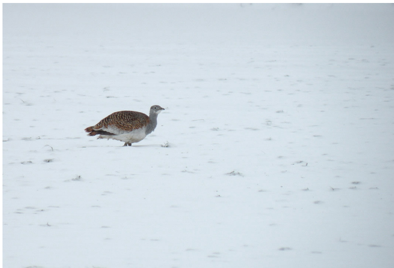
Grote trap, Groesbeek, 24 dec 2010.