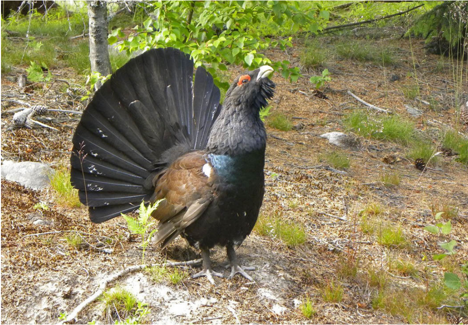
Auerhaan, Skovde, Zweden, juni 2010.

Opwindend is nog wel de ontmoeting met een Auerhaan aan de westkant van de Vättern. We zijn getipt om rond een kaalslag te zoeken, maar dat is niet nodig. Het beest komt al op ons af en blijft in de houtwal tussen kaalslag en weg naar ons blazen. Als een van ons hem nadert voor nog mooiere foto's is een schijnaanval voldoende om achteruit te stuiven.