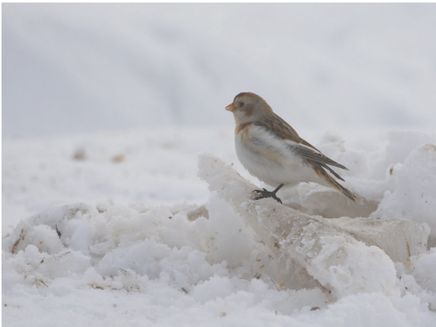
Sneeuwgorz, Persingen, 30 dec. 2010.

De verschillende trektelposten, de Hamert, Gassel-De Kampen en Maldens Vlak, hadden ook het genoegen overvliegende of kort ter plaatse zijnde IJsgorzen te zien. Een paar waarnemingen ook van de Sneeuwgorz . De eerste op 29 nov. bij het Karbrugse Veld gemeente Lingewaard en de laatste van deze periode, twee exemplaren die op 2 jan. in de Ooijpolder bij Persingen te zien waren.