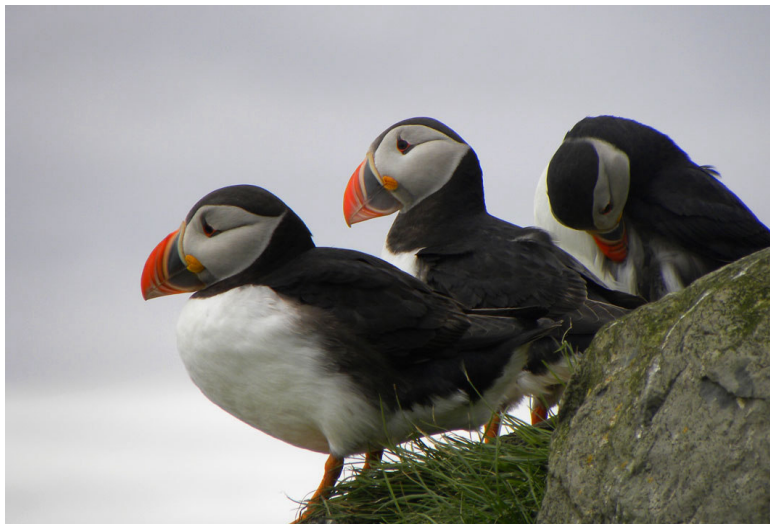
Papegaaiduikers, Hornoya, Noorwegen, juni 2010.

We rijden verder, bijna tot het punt tot waar je nog met de auto kunt komen. We stoppen bij de wilgenbosjes van Sandford. Hier zou het moeten krioelen van de vogels en we blijven er dus slapen. We zien Oeverpiepers, een Roodkeelpieper, een baltsende Watersnip en ontdekken eindelijk een (roodster) Blauwborst op zang. Ook zingende Koperwiek, Fitis natuurlijk, Kempmaan, Tureluur en een Goudplevier naast ons 'keukenraampje'. Hoogtepunt is hier de ontdekking van een Witstuitbarmsijs. We zijn hier twee dagen en rijden ook nog het laatste stukje naar Hamningberg. Jan van Genten of een Sneeuwgorz zijn ons daar niet gegund.