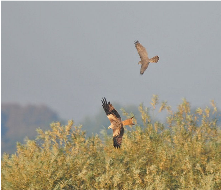
Rode Wouw, Circul, 10 okt. 2010.

Voor vogelaars die van puzzelen houden, een paar hybride eendencombinaties , een Krooneend x Tafeleend, werd op 28 nov. bij Beugen De Vilt gezien en een Kuifeend x Tafeleend werd op 10 nov. en 15 dec. op de Regtersteegse Weiden bij Gennep waargenomen. Een vrouwtje Middelste zaagbek vloog op 20 nov. langs de Maas ter hoogte van Gassel - De Kampen.