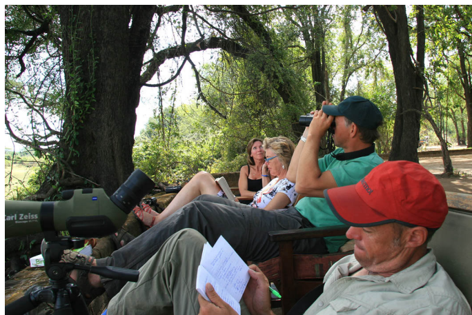
Aan de soortenlijst werken vanuit de luie stoel.

De volgende stop waren de Shoebills. Met een korte, binnenlandse vlucht en een aansluitende, spectaculaire kanotocht, kwamen we aan op een eiland in een groot moeras. En bij de eerste de beste excursie per kano was het direct al raak. De Shoebills waren niet te missen. Met een gevoel van de eerste ontdekkingsreiziger die op een aanvankelijk onbekend eiland de vleugelloze Dodo voor het eerst gewaar wordt, zo zagen we onze eerste Shoebills. Op de terugweg zagen we nog enige stropers aan het werk. Wat volgde bleek een van de kernactiviteiten van het team aldaar: op blote voeten werd in draf het moeras bedwongen en werden de stropers verdreven. Door de plotselinge actie moesten die hun kano (een soort uitgehouwen boomstam) achterlaten en deze werd direct geconfisqueerd. Zo'n kano heeft een straatwaarde van drie maandsalarissen, dus dit bleek een effectieve strafmaatregel. Helaas waren de stropers zelf gevlogen, al bleken dit later ter plaatse bekende lieden en werd er op andere indirecte wijze recht gesproken. Wel lastig, als je ziet in wat voor armoede de meeste mensen daar moeten leven; stropen is dan toch voorzien in de eerste levensbehoefte. Op korte termijn begrijpelijk, op langere termijn echter niet vol te houden. Dat is dus de boodschap die de natuurbeschermers daar te verkondigen hebben. Opnieuw werden we gastvrij en door ontzettend vriendelijke medewerkers verwend. De lijst met soorten groeide.