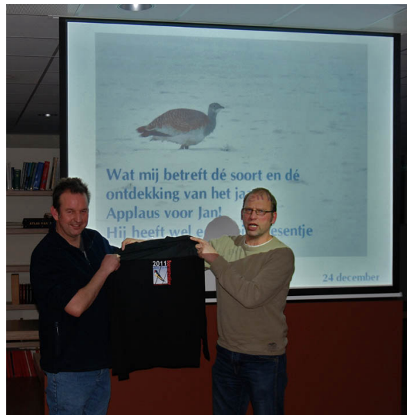
Jan ontdekte dé soort van 2010, de Grote Trap.

De vogel werd helaas opgejaagd door een passerende auto en vloog weg in zuidwestelijke richting. Dezelfde dag zag iemand in Venray een mogelijke Grote trap overvliegen hetgeen zeer goed mogelijk kan zijn geweest gezien het feit dat de Trap op Kerstmis in de provincie Zeeland door velen, maar helaas voor het laatst is gezien.