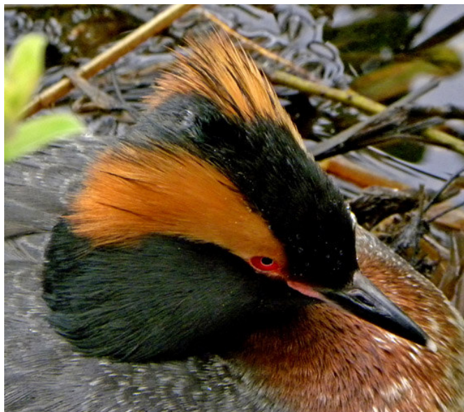
Kuifduiker, Parikkala, Finland, mei 2010.