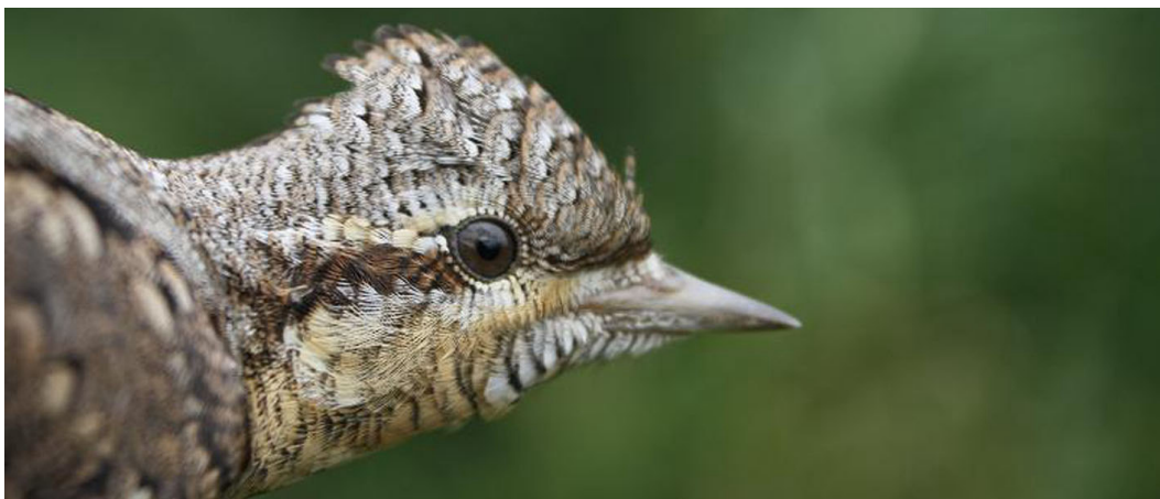
Alweer de twaalfde Draaihals, Ooijse Graaf, 2 sept. 2010.

Tot slot is Rietgors ook een vrij veel gevangen soort. Vooral tijdens de najaarstrek kan de soort met behulp van geluid goed worden gevangen met 23 ex op 13 oktober. In totaal 93 dit jaar.