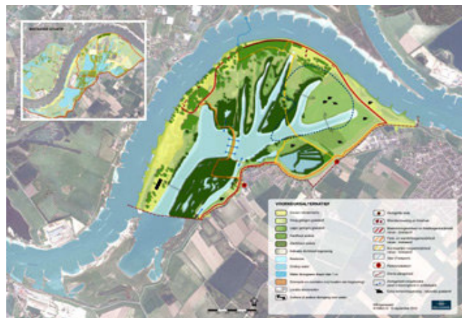
Herinrichting van de Millingerwaard.

In 2015 moet het gebied voldoen aan de normen voor veiligheid (dus hoofdgeulen klaar) en 2020 moet de inrichting afgerond zijn.