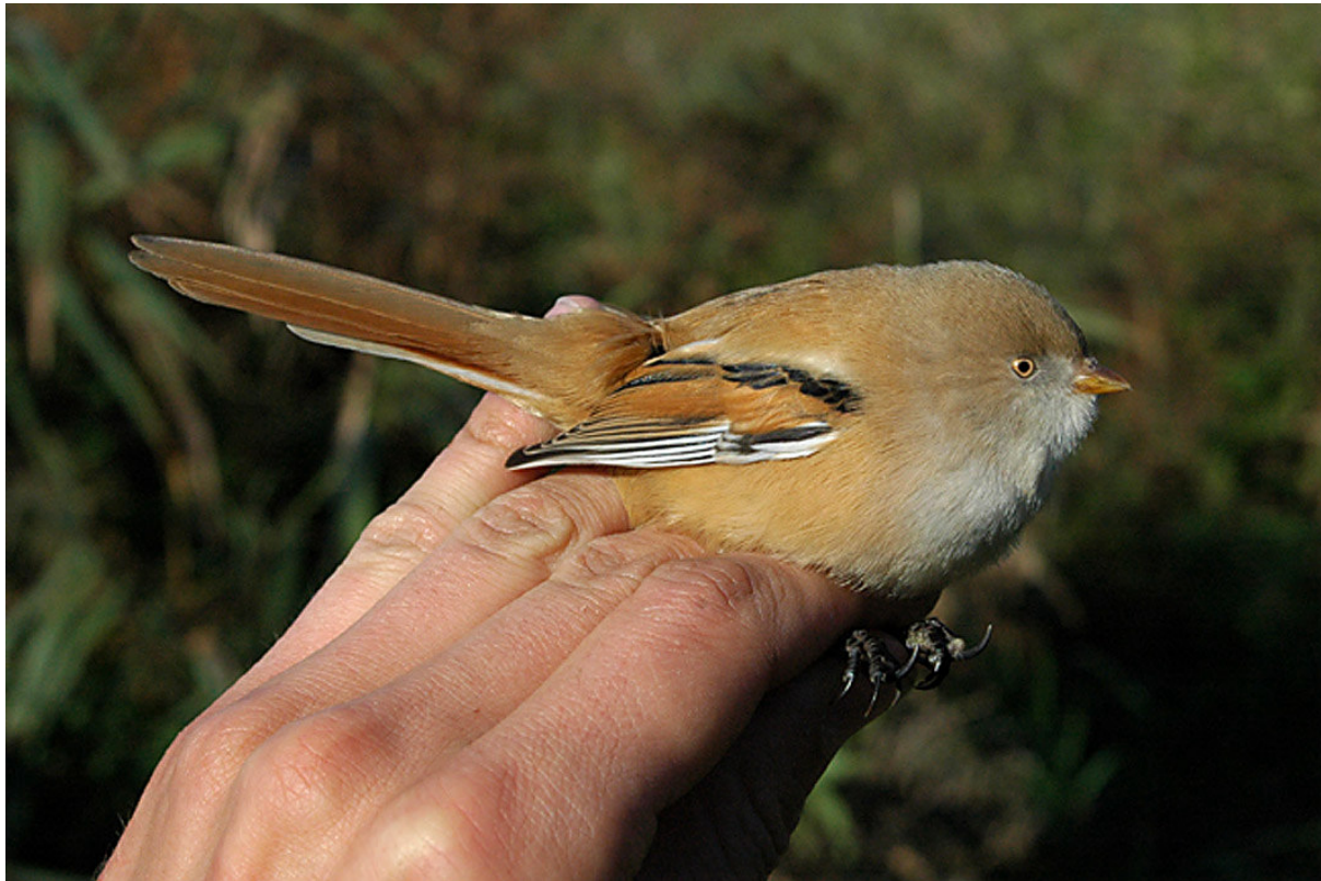
Bardman vrouw, Ooijse Graaf, 18 okt 2010.