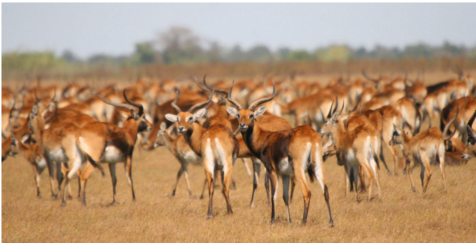
Ontelbare Leches, een soort hert.