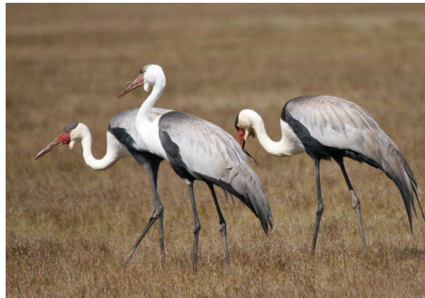
Wattled Cranes.