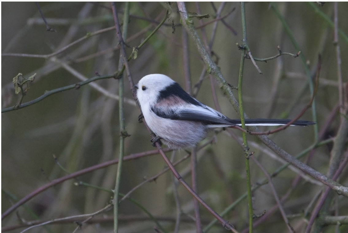
Witkopstaartmees, Zwanenbroekje, 9 jan. 2011.

De Middelste bonte specht was te horen en zien op de bekende plekken rondom de Wylerberg en op 31 jan. bij de Hamert-Geldernsch-Nierskanaal. De grootste groep van de Waterpieper vloog op 15 nov. over de Kraaijenbergse Plas nummer 7. De Pestvogel deed aanvankelijk z'n naam eer aan, namelijk 'pesten'. Ze bleven niet lang ter plaatse, maar doken wel op veel plaatsen op. Op de sluitingsdag van het jaar 2010, 31 dec., waren er maar liefst 35 overvliegend te zien in de wijk Weezenhof, Nijmegen. Een laatste waarneming ooit van de Tapuit in het werkgebied, werd gedaan op 27 november bij de Kraaijenbergse Plas 9 Heeswijk. De laatste waarneming van de Roodborsttapuit werd gedaan op 14 dec. Hierna werd het onaangenaam koud voor ze en zijn ze tot vandaag, schrijvende 15 febr., nog niet teruggezien. Een erg late Beflijster vloog op 2 nov. nog over de trektelpost Maldens Vlak. Niet elke Zwartkop was naar het zuiden gevlogen getuige de waarnemingen bij wintervoer en vetbollen in Nijmegen, Malden, Beek-Ubbergen en Wijchen.