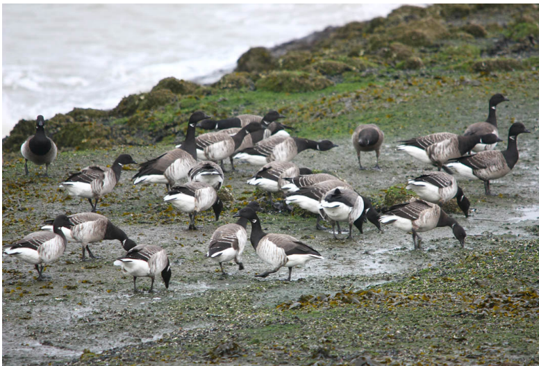
Een deel van de groep Witbuiken op de Brouwersdam.

De teller van de dag stond uiteindelijk op zo'n 90 soorten en 15 minuten na de geplande eindtijd stapten we weer uit bij het HD-gemaal. Jos, bedankt!