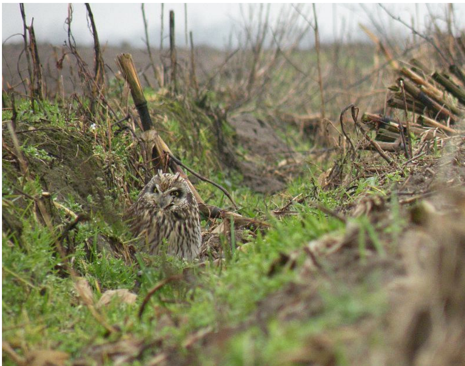
Velduil, Breedeweg, 12 febr. 2011.

Een niet bepaald alledaagse soort is de Rosse grutto , en dan ook nog in een respectabele groep! Op 8 nov. vlogen er 33 exemplaren over de trektelpost Maldens Vlak en op 16 jan. vlogen er zo'n 30 over de Oosterhoutse Waard. Tijdens tochten door vochtige terreinen in het werkgebied werd er regelmatig een Bokje 'opgepest'. Twee novemberwaarnemingen van de Groenpootruiter waren de laatste van het jaar 2010. Twee waarnemingen alweer van de soort in jan. 2011, en wel op 16 jan. langs de Kerkdijk in de Ooijpolder. Op 20 en 21 nov. was een eerste winter Dwergmeeuw ter plaatse bij de Koningsvennen Milsbeek.