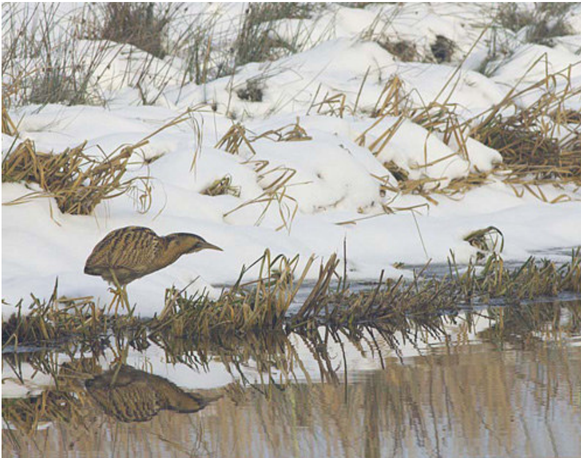
Roerdomp, Zwanenbroekje, 29 dec. 2010.

De Kraaienbergse Plas 9 was goed voor twee exemplaren van de Krooneend van 6 - 27 dec. Meestal werd er trouwens maar eentje gezien. Ook in de Millingerwaard en Kaliwaal bij Kekerdom werd een enkel mannetje gezien. De Topper , een vrouwtje in dit geval, werd op 22 jan. tot in ieder geval 1 febr. op plas 8 'Op den Druif' van de Kraaienbergse Plassen waargenomen.