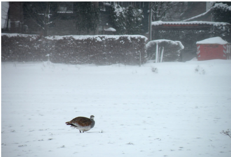
Grote trap, Groesbeek, 24 dec. 2010.

Vanaf 1986 is het een CDNA-beoordeelsoort. Zeeland was de enige provincie waar de soort sinds 1800 nog niet was vastgesteld. In de 21e eeuw was er tot nu toe alleen de waarneming van een in Duitsland uitgezet exemplaar met halszender en roze kleuring in december 2004 bij Beltrum, Gelderland. Deze niet-telbare vogel werd verzwakt gevangen en teruggebracht naar Duitsland. Behalve in Duitsland lopen er ook herintroductieprojecten in bijvoorbeeld Engeland en Oostenrijk. Engelse projectvogels met vleugelmarkeringen zijn al uitgezworven tot in Frankrijk.