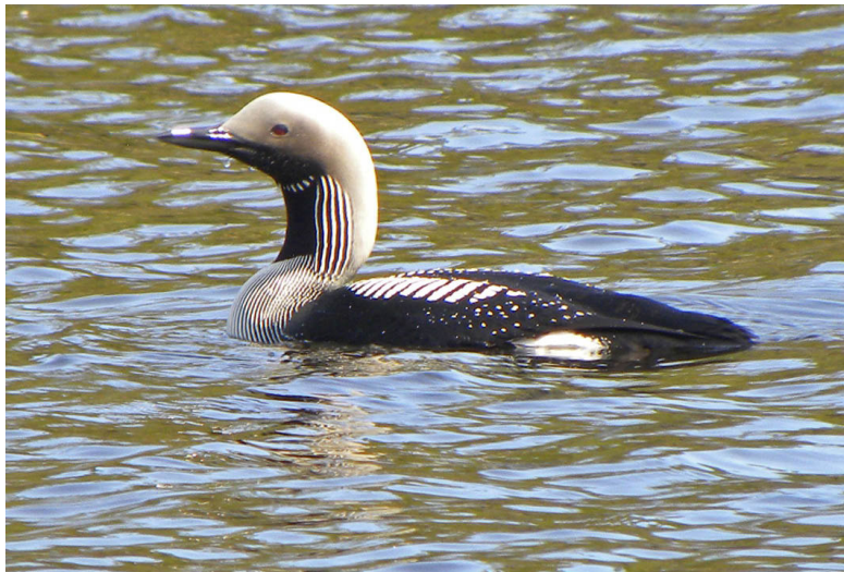
Parelduiker, Skuleskogen Zweden, juni 2010.