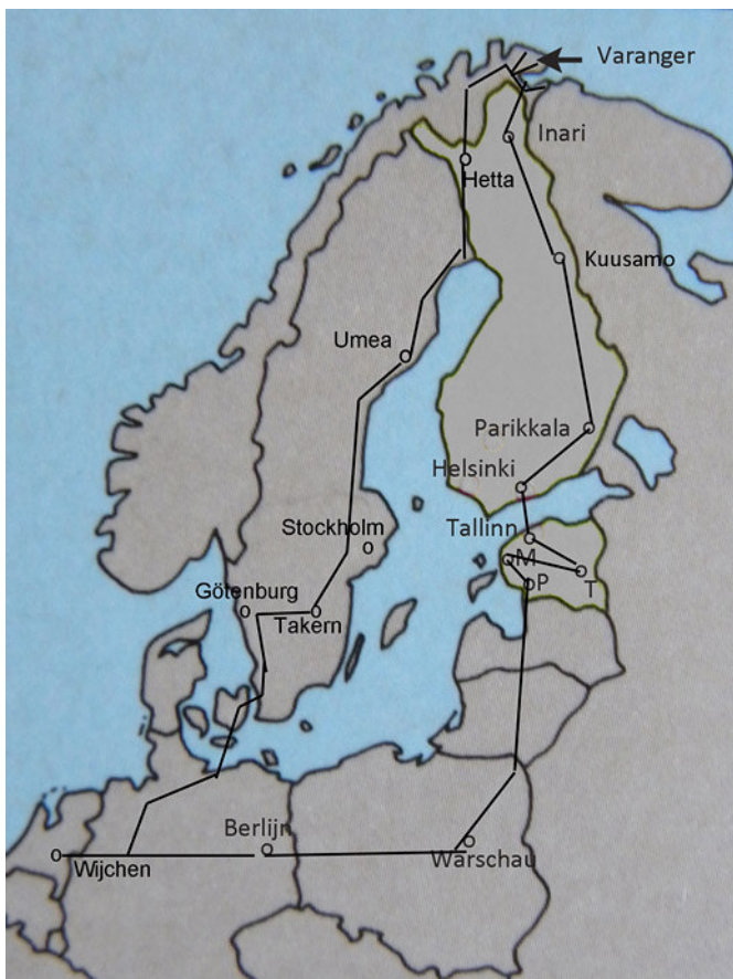
Reisroute (M=Matsalu, P=Pärnu en T=Tartu).

Bij het naburige Haapsalu bezoeken we een afgesloten zeearm en op dit meer zitten onze eerste Roodhalsfuten en Dwergsterns. Ook hier twee uitzichttorens en we lopen onze eerste boardwalk. Een vlonderpad door het moeras en je loopt op planken tussen het riet en de Baardmannetjes door.