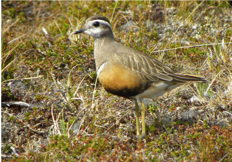
Morinelplevier, Pallastunturi, Finland, juni 2010.

Het volgende doel is de rotsformatie Pallastunturi bij Hetta in Finland bij de Zweedse grens. Met een klimtocht hier hebben we het geluk een beetje afgedwongen. In de Crossbill-serie 'Finnish Lapland' staat bij de routebeschrijving een mannetje Sneeuwgorz in zomerkleed. Die willen wij ook wel zien. Terwijl we halverwege de tocht Rendieren fotograferen, zien we een wit-zwart beest vliegen en vlak bij invallen. De Sneeuwgorz vliegt steeds een stukje verder als hij vindt dat we te dichtbij zijn totdat.... er plotseling een Morinelplevier voor ons wegloupt. Dit juweel laat zich juist heel dichtbij benaderen.